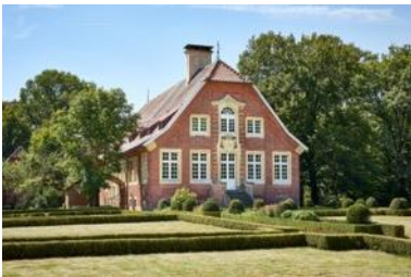
Haus Rüschaus