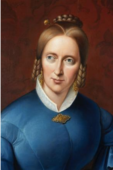
Johann Joseph Spricks Porträt der Dichterin Annette von Droste-Hülshoff