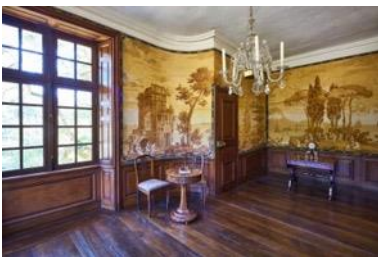
Italienisches Zimmer im Haus Rüschaus